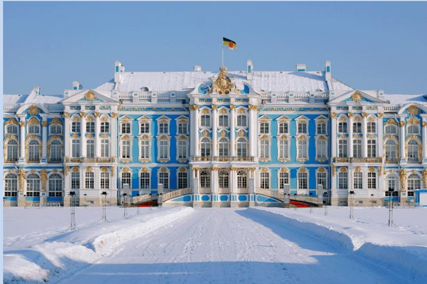
Bild: Katharinenpalast in Puschkin