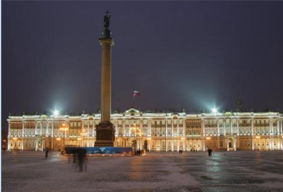
Bild: Eremitage / Schlossplatz