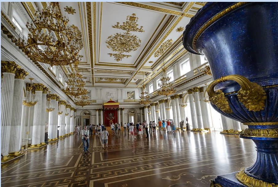
Der Große Saal (Thronsaal) der Eremitage