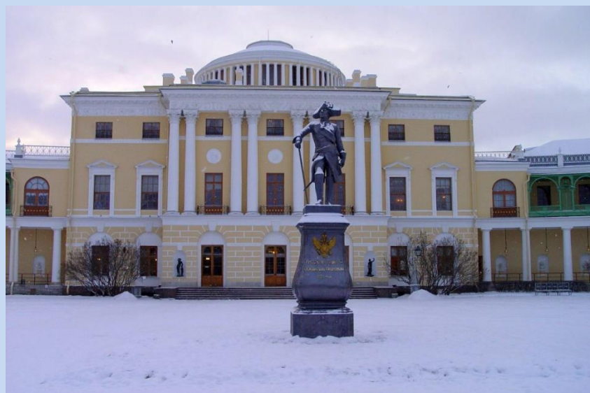
Bild: Schloss in Pawlowsk