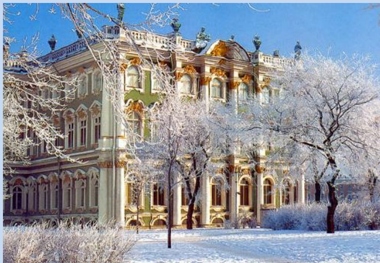
Bild: Der Winterpalast