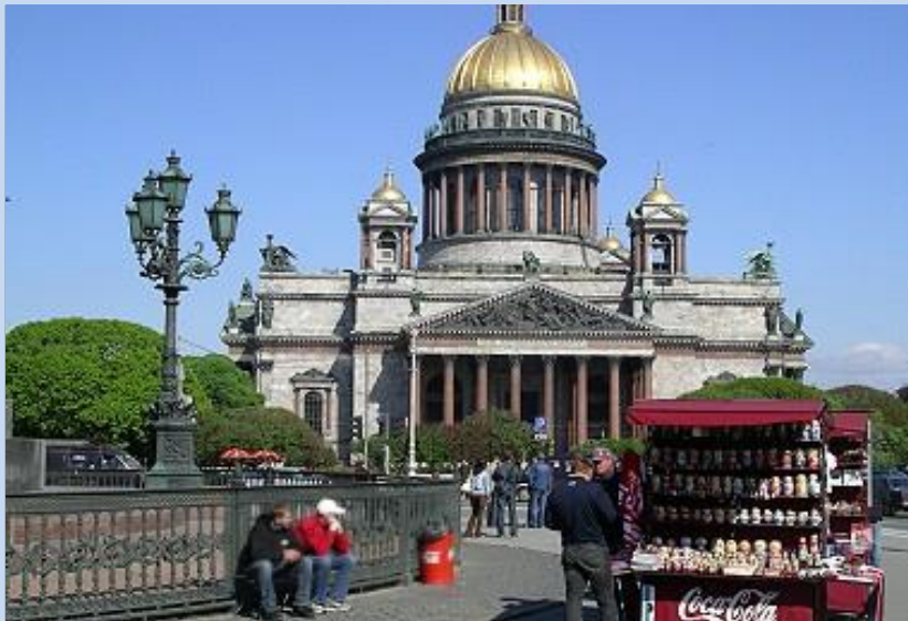
Die grandiose Isaakskathedrale