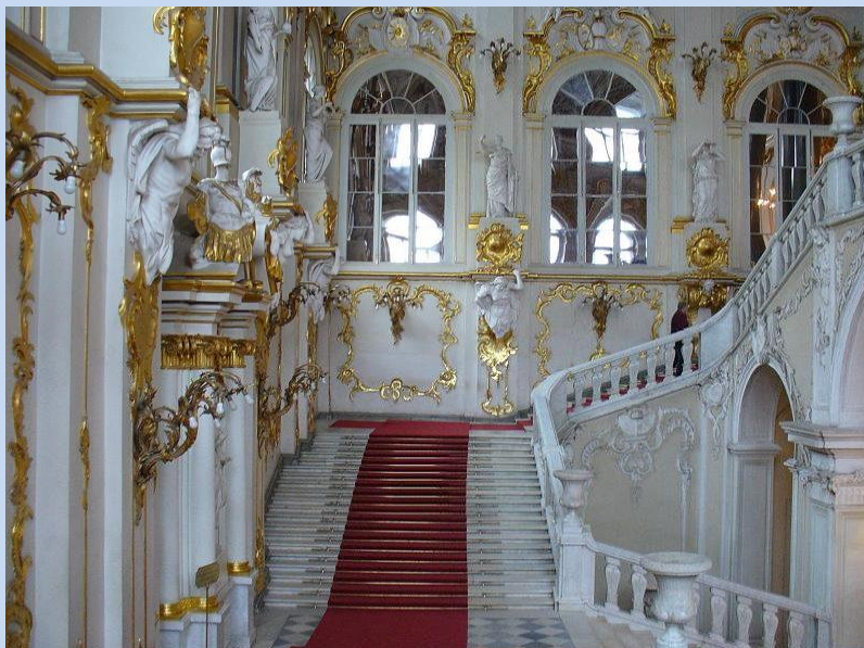
Ermitage / Winterpalast

(Tipp!) Erleben Sie gegen Mitternacht das Öffnen der gigantischen Newa-Brücken. Ein unvergessliches und grandioses Schauspiel. Ihr Vorteil: Sie wohnen nur wenige hundert Meter entfernt!