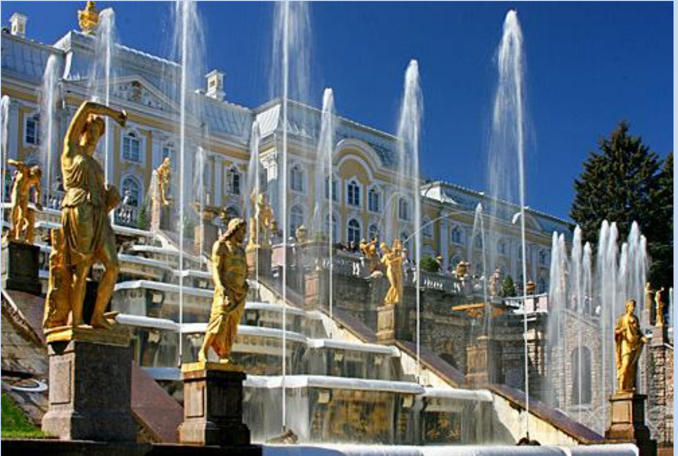
Zarenresidenz Peterhof, Die Große Kaskade