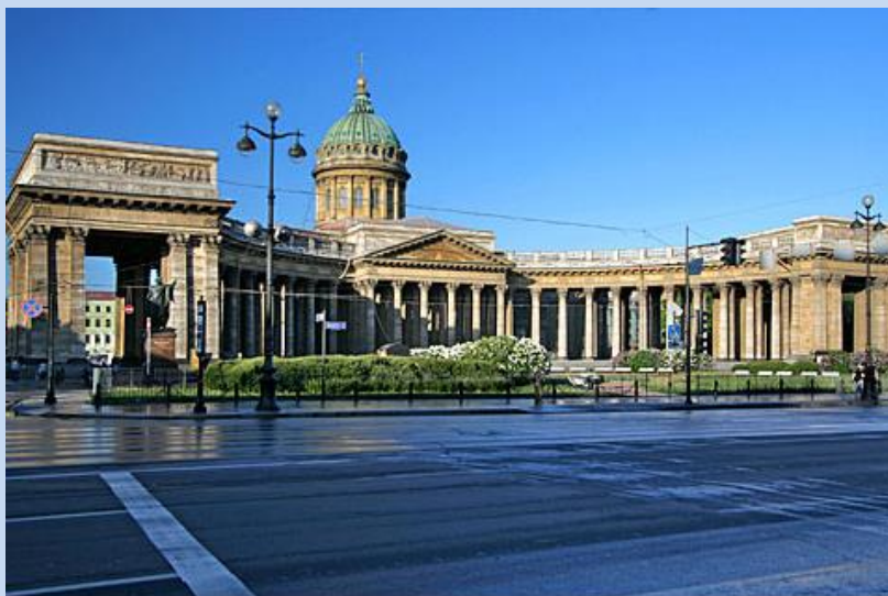
Die grandiose Kasaner-Kathedrale