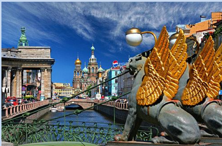
Griboedowa Kanal am Newski Prospekt.

St. Petersburg nennt man auch „ein Museum unter freiem Himmel.“ Sie wohnen direkt im historischen Stadtkern - mitten unter den Palästen.