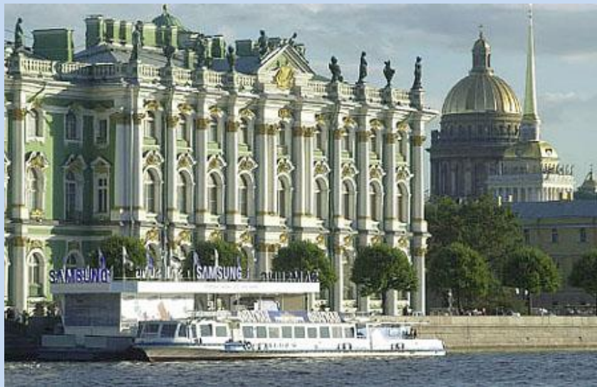
Schloßkai an der Eremitage