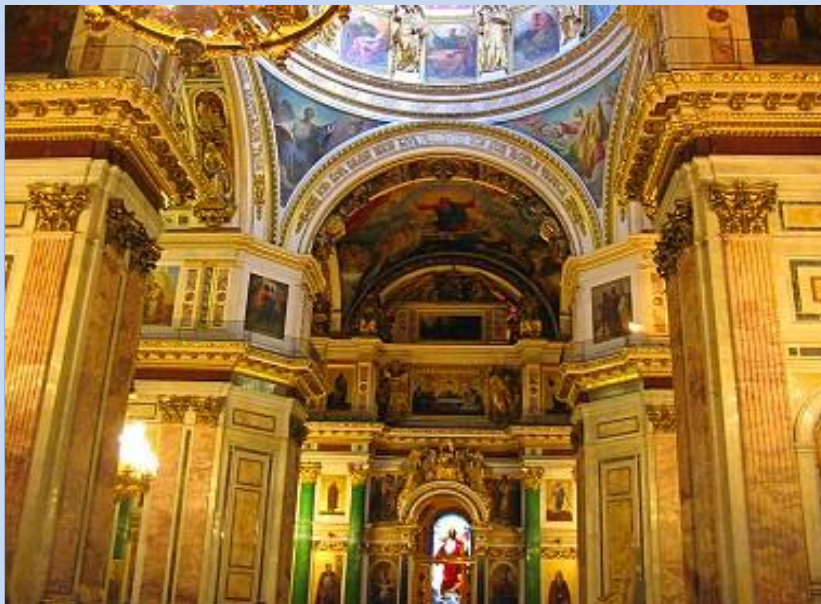
Das mächtige Innere der Kathedrale

Für alle angebotenen Transfers steht Ihrer Privatgruppe ein guter PKW/ Minivan mit einem persönlichen Chauffeur zur Verfügung. Das komplette angebotene Programm inkl. aller angebotenen Transfers, Bootsfahrt und Eintrittsgelder ist inklusive. Das Besichtigungsprogramm ist unsere Empfehlung – es ist gut durchdacht und ist ein Muss jeder Petersburg Reise. Das Programm wird im Umfang wie beschrieben organisiert, könnte jedoch zu gegebener Zeit im Ablauf der Reihenfolge individuell optimiert werden. Sie können das Programm gerne mit uns besprechen und gegebenenfalls anpassen.