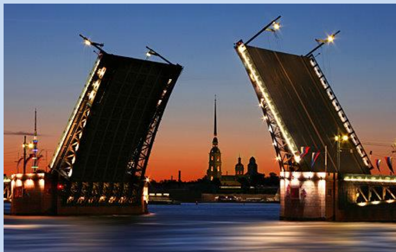
Abendlicher Blick auf die Uferpromenade, unweit von Ihrem Hotel!