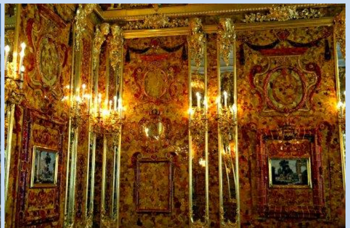
Das legendäre Bernsteinzimmer