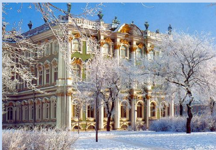
Bild: Der Winterpalast