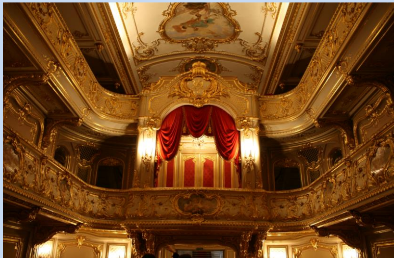
Bild: Privater Theatersaal des Jussupow Palastes