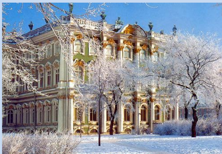
Bild: Der Winterpalast