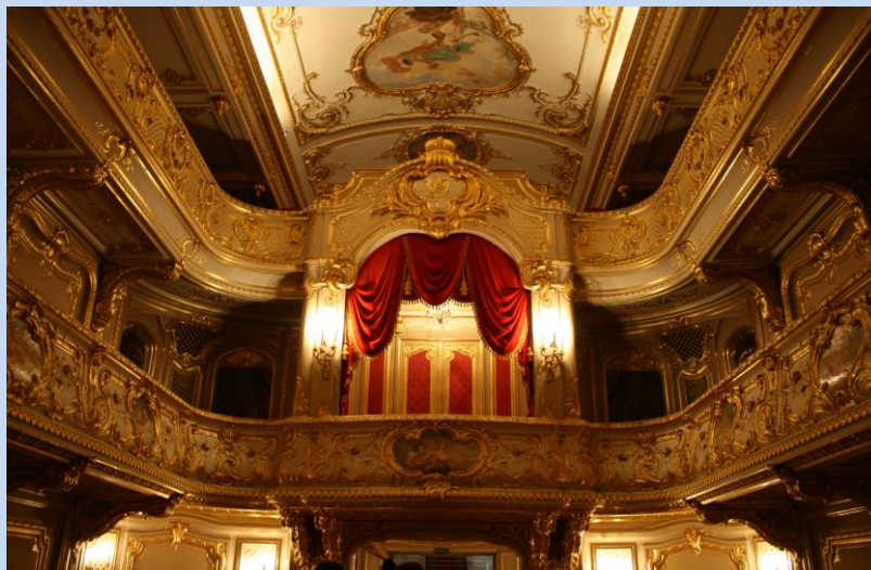
Bild: Privater Theatersaal des Jussupow Palastes