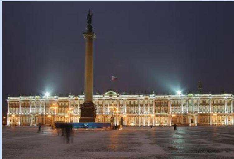
Bild: Eremitage / Schlossplatz