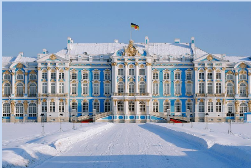
Bild: Katharinenpalast in Puschkin