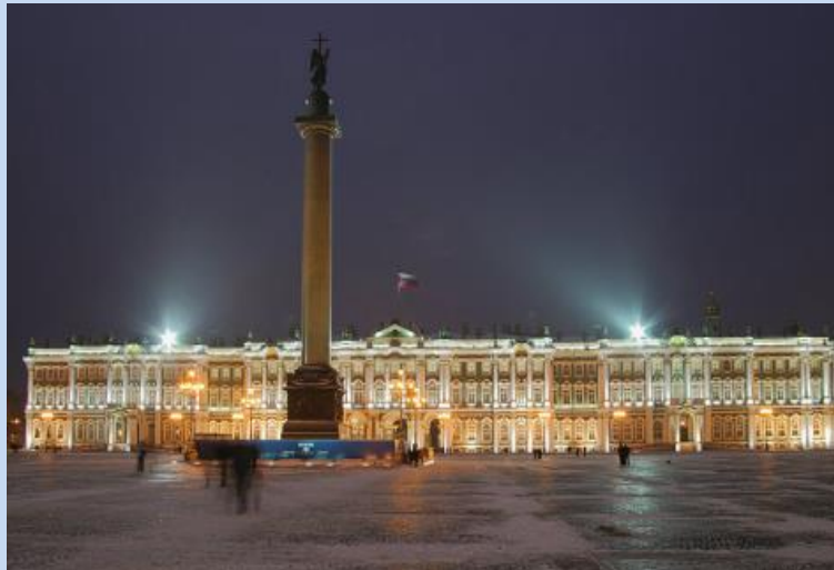
Bild: Eremitage / Schlossplatz