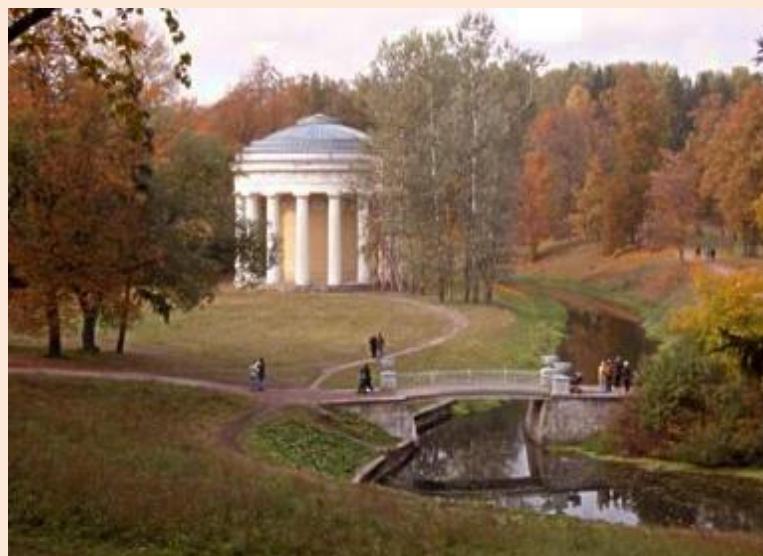
Bild: Zarenresidenz Pawlowsk