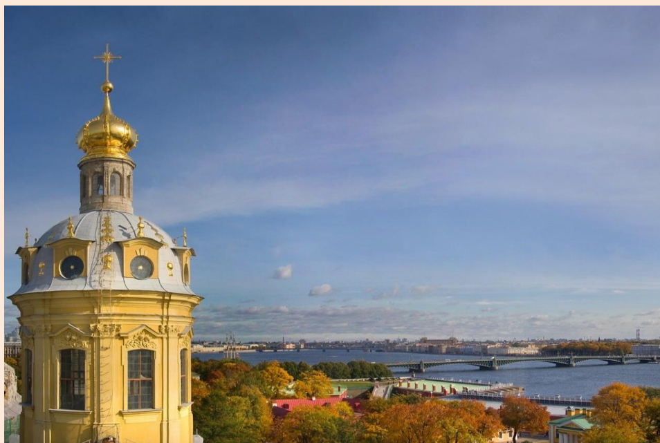
Bild: Blick auf Newa