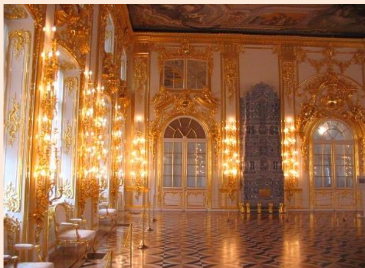
Bild: Grosser Saal im Katharinenpalast