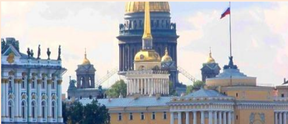
Stadtzentrum. Admiralität, Isaakskathedrale und Eremitage