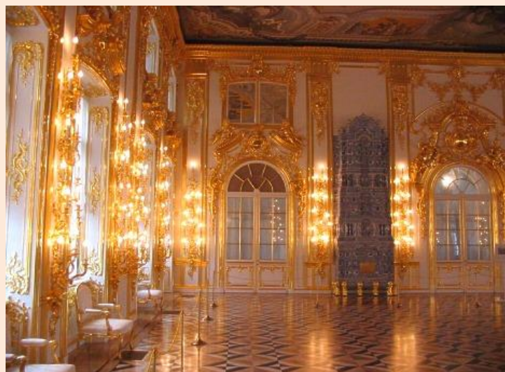
Bild: Grosser Saal im Katharinenpalast