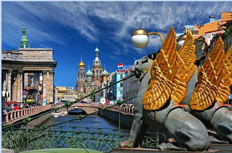
Griboedowa Kanal am Newski Prospekt.

Sie wohnen direkt im historischen Stadtkern - mitten unter den Palästen.