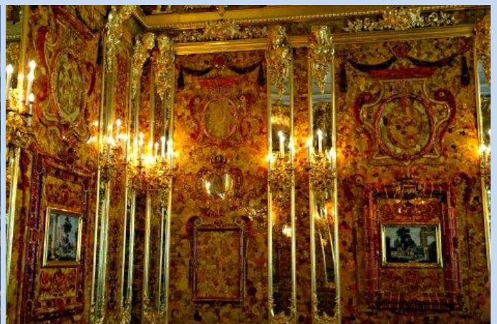
Das legendäre Bernsteinzimmer