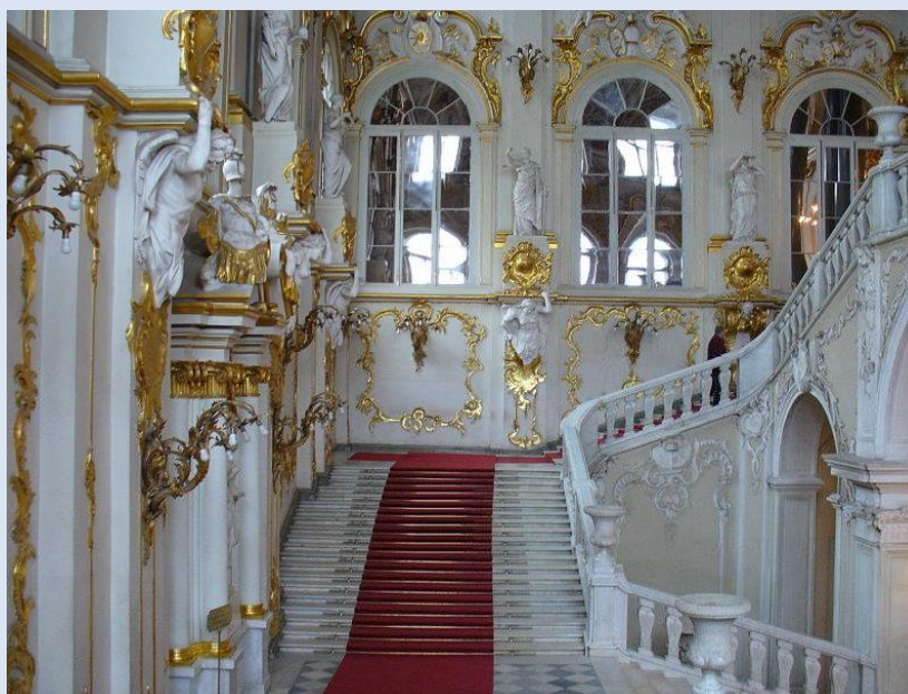
Jordanantreppe in der Eremitage