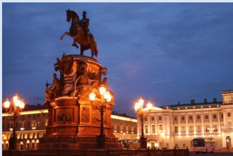
Isaaksplatz mit dem Denkmal des Zaren Nikolaus I.