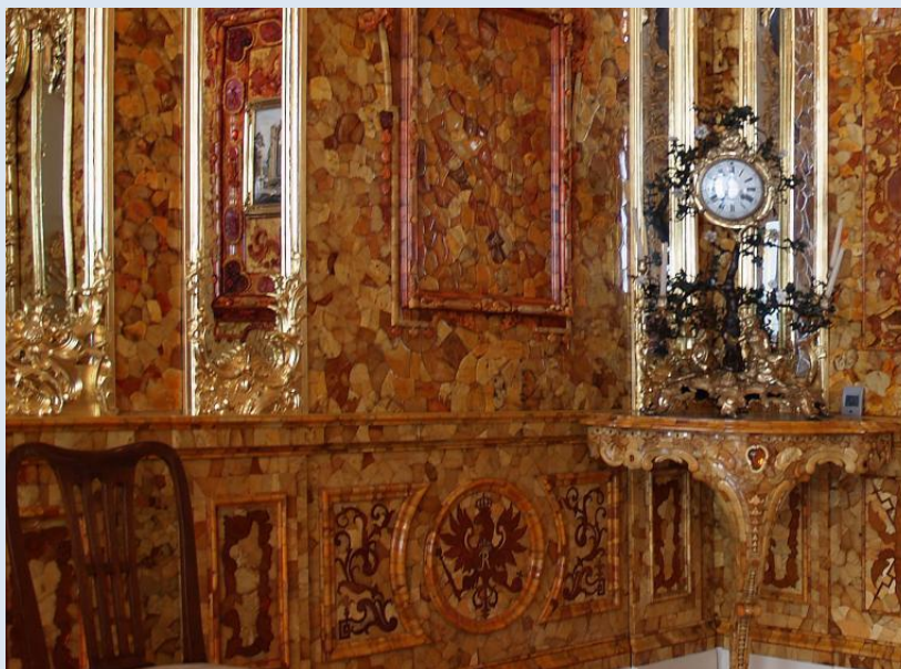
Das legendäre Bernsteinzimmer