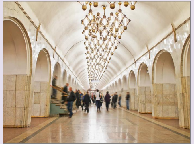
Moskauer prachtvolle Metrostation