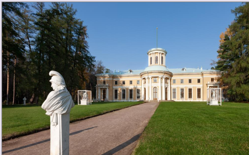
Schlossanlage – Archangelskoje