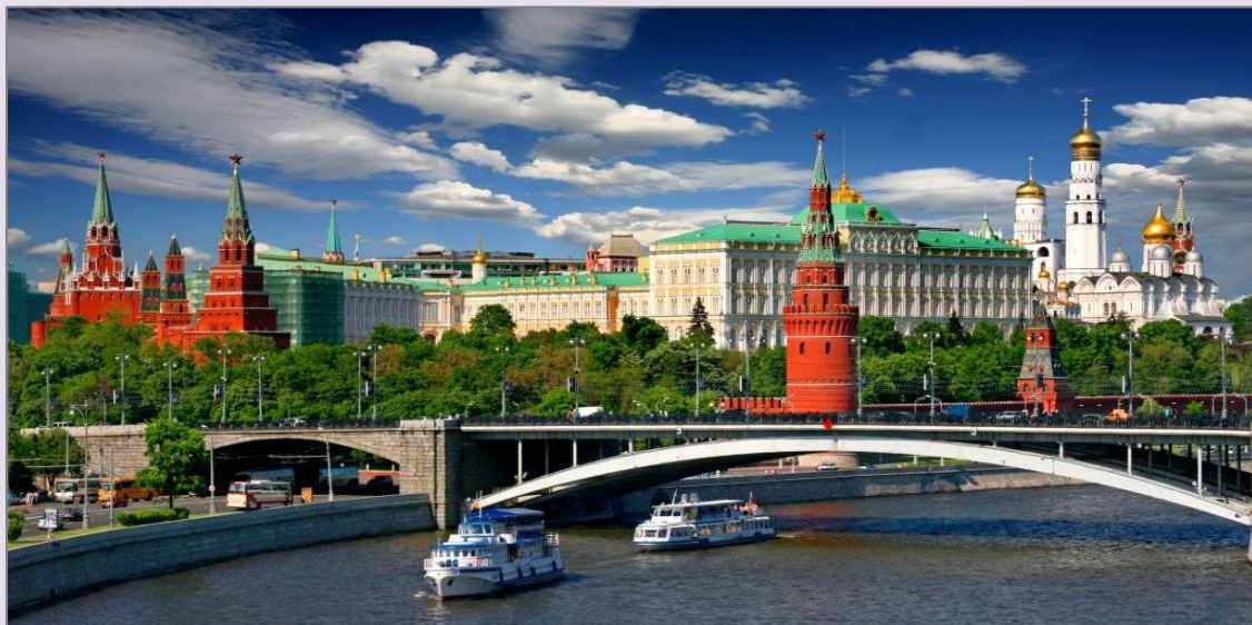
Aussichten von der Moskwa aus