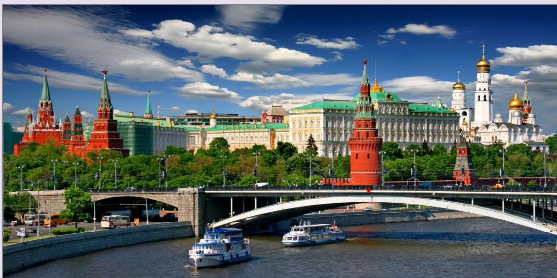
Aussichten von der Moskwa aus