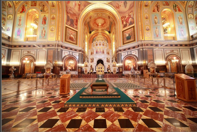
Impressionen beim Spaziergang durch Moskau/Christi Erlöser Kathedrale