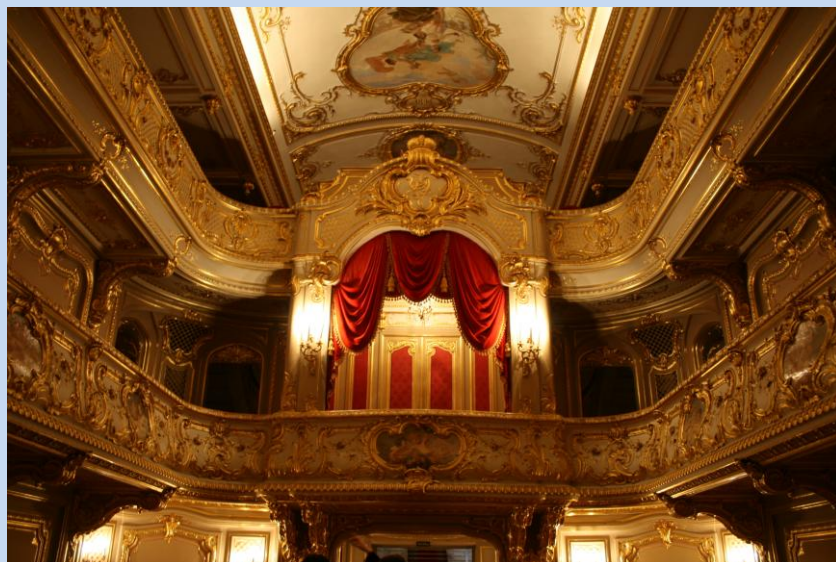
Privater Theatersaal im Jussupow-Palast