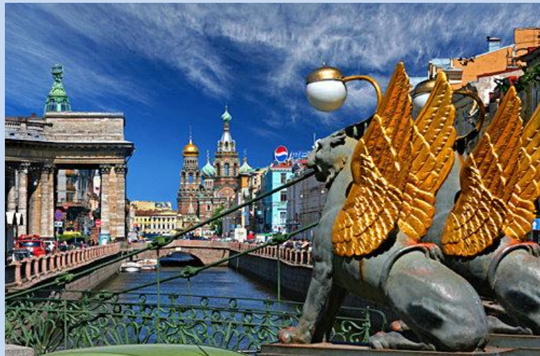
Griboedowa Kanal am Newski Prospekt.