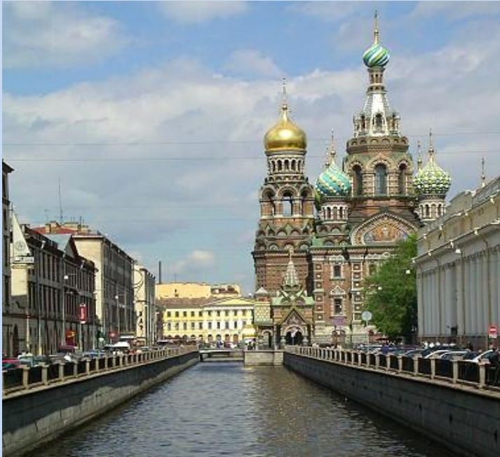
Die Auferstehungskathedrale am Gribojedowa Kanal