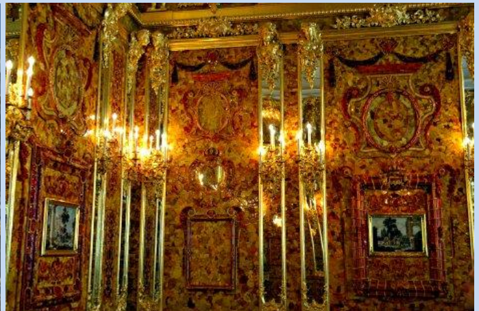
Das legendäre Bernsteinzimmer