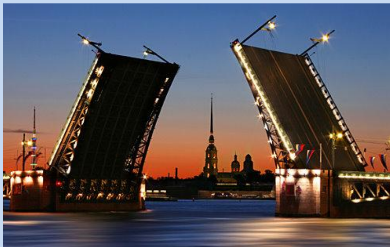
Abendlicher Blick auf die Uferpromenade, unweit von Ihrem Hotel!