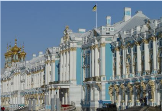
Katharinenpalast in Puschkin