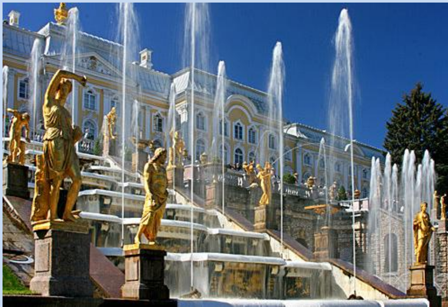
Zarenresidenz Peterhof, Die Große Kaskade